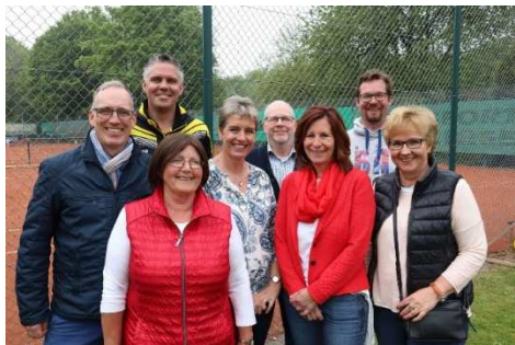
Tennis-Vorstand freut sich über das gelungene Jubiläumsfest

Viele Kinder tobten aber auch neben den Plätzen: Während die Größeren an einer Olympiade teilnahmen, vergnügten die Kleinen sich auf dem Spielplatz.